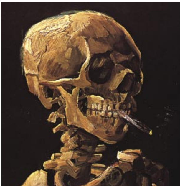
„Lobanja s tlečo cigareto“, Vincent Van Gogh, 1885.