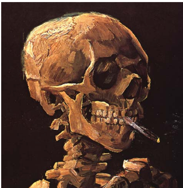
"Teschio con sigaretta accesa" di Vincent Van Gogh, 1885.