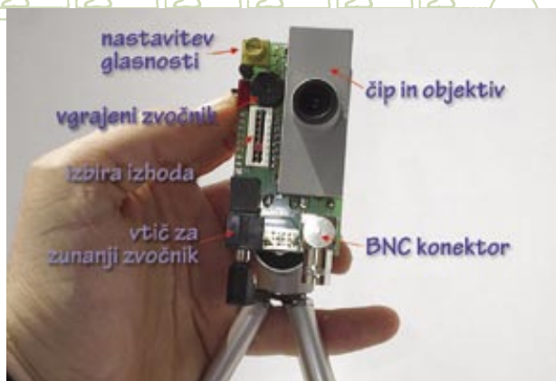
Objektiv kamere se nahaja pred silikonsko mrežnico.

Nevrone v tem prototipu imenujemo „ nevroni seštej-in-sproži “, nevromorfni inženirji jih pogosto uporabljajo. Svoje ime so dobili, ker seštejejo utežen vnos, kodiran v obliki napetosti, ki prihajajo na njihove sinapse, ter se odzovejo s sproženjem akcijskega potenciala, zgolj kadar napetost preseže postavljeni prag. Silikonski nevroni so zgrajeni iz tranzistorjev, vendar namesto, da bi jih uporabljali kot stikala s pomočjo povečevanja napetosti do saturacije – enako kot v konvencionalnem digitalnem sistemu – so tranzistorji uporabljeni v podpraznem razponu. V tem območju se obnašajo podobno kot celične membrane dejanskih nevronov. Dodatni tranzistorji priskrbijo aktivne prevodne lastnosti za posnemanje od napetosti in časa odvisnih ionskih kanalčkov. Ta majhen vidni sistem je prototip za mnogo kompleksnejše umetne vidne sisteme, ki so v razvoju. Že njemu uspe prikazati, kako je možno v realnih razmerah izredno hitro procesirati vhod z veliko šuma in oblikovati enostavne odločitve. Uspeva mu opravljati tisto, za kar je bil oblikovan – sporočati orientacijo črte v prizoru – in nevroznanstveniki že uporabljajo ta enostavni silikonski vidni sistem za preizkušanje opreme in trening študentov. Najpomembnejše lastnosti umetnih mrež so, da delujejo v resničnem svetu, v dejanskem času in porabljajo zelo malo energije.