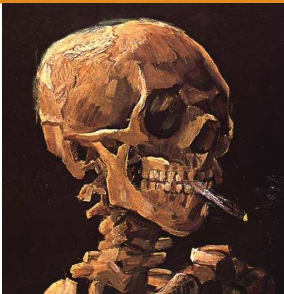
"Череп с зажженной сигаретой", Винсент Ван Гог, 1885.