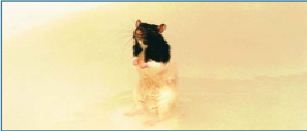
ラットは、今立っている、隠されていたプラットホームに向かってプールの中を泳いだ。

例えば、ラットやマウスは、水槽の中で泳がせ、水面下の一箇所に隠されている避難用のプラットホームを発見するように訓練することが出来る。彼らは、場所細胞と方向細胞を道筋を見出す助けとして用い、そして、NMDA受容体によって引き起こされる可塑性を使用してプラットホームの正しい存在場所を記憶の中に符号化する。また、海馬からNMDA受容体を取り除いた遺伝子ノックアウトマウスが作製されている。これらの動物は学習能力が悪く、彼らは、非常に不正確な場所細胞を有している。前章において、私たちは、シナプスの重量が、興奮性AMPA受容体の変化を介して現われることを説明した。私たちは、未だ、それが真実の記憶かどうか知らない。それは、今まさに、激しい研究の課題となっている。