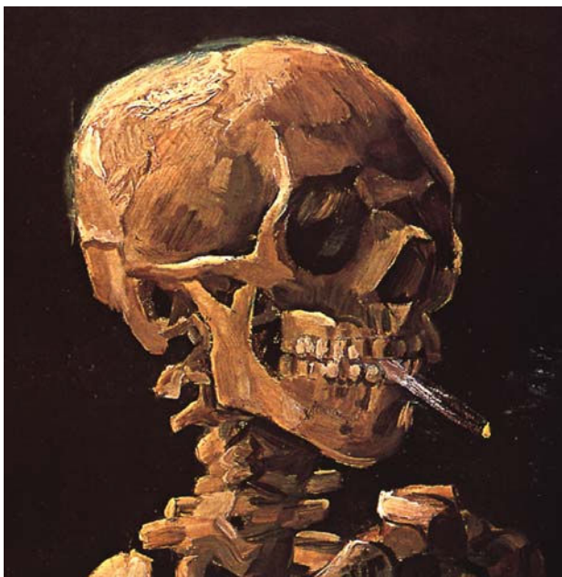
„Lubanja s cigaretom“ Vincent Van Gogh 1885.